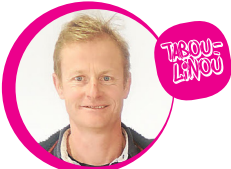
> David ar Gall